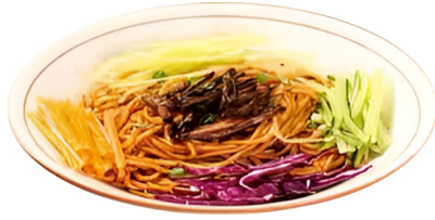
(半固态复合调味料)