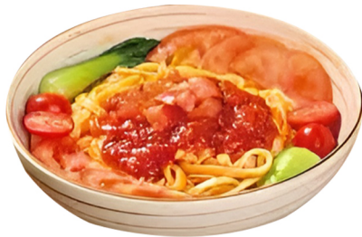
(半固态复合调味料)